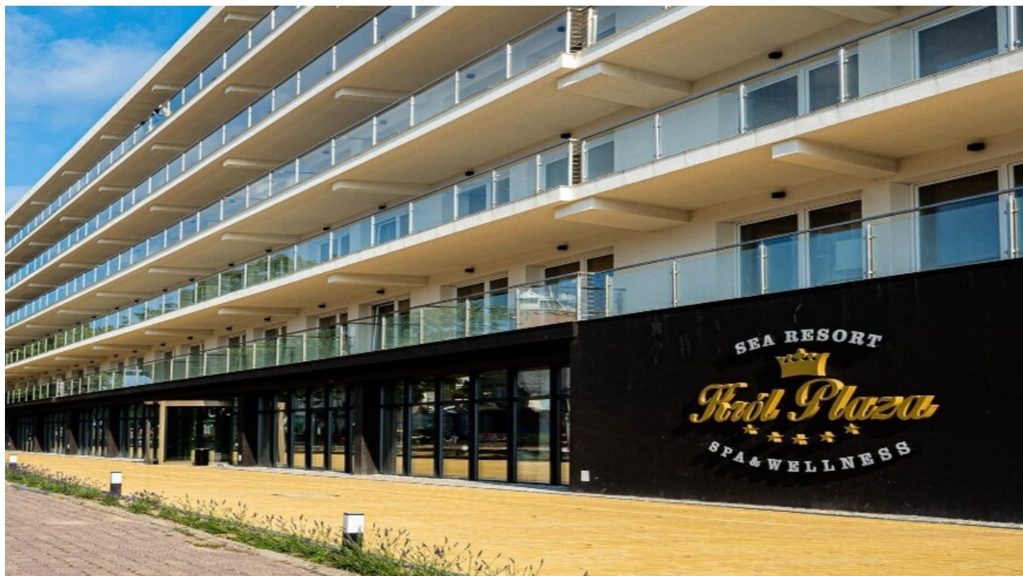
Hotel Król Plaza - pozyskane dofinansowanie: 5 873 535 zł